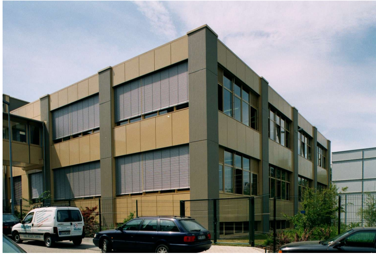
Ansicht fertiggestelltes Produktionsgebäude

Neubau eines mehrgeschossigen Produktionsgebäudes in Massivbauweise mit Stahl-Verbindungsbrücke zum bestehenden Gebäude.