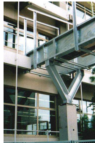
Verbindungsbrücke im Bau