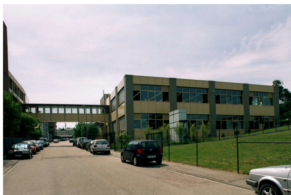
Ansicht Neubau mit Verbindungsbrücke