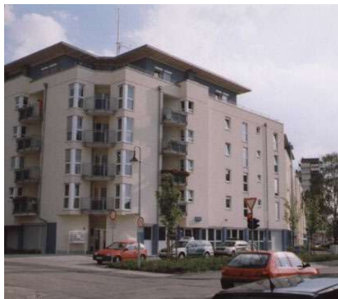
Ansicht von Nordosten

Tragwerksplanung: Ing.-Büro Braun & Partner GbR