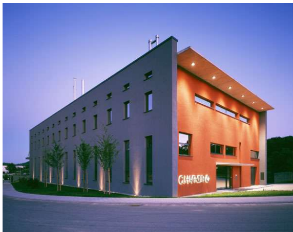
Ansicht bei Nacht