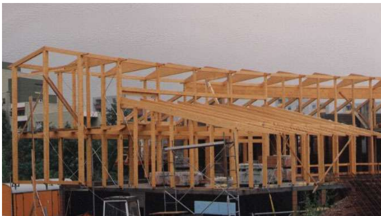
Holzkonstruktion im Bauzustand

Tragwerksplanung: Ing.-Büro Braun & Partner GbR