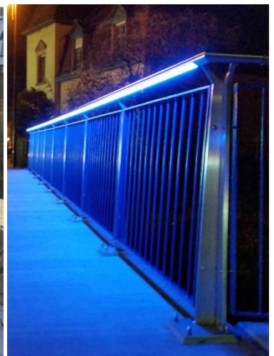
Detail Kappe und Geländer vor und nach der Instandsetzung bzw. mit Handlaufbeleuchtung