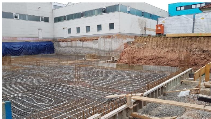
Bewehrung Bodenplatte mit Betonkerntemperierung