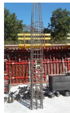
Bewehrung einer Stütze