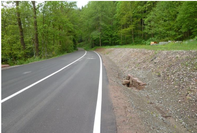
fertiges Teilstück mit neuer Entwässerung

Schwarzdeckeninstandsetzung, Abbruch von Stützwänden, Herstellen von Entwässerungsgräben und offenen Asphalttrinnen, Einbau von Ablaufschächten und Dolen, Aufbringen eines wassergebundenen Belags