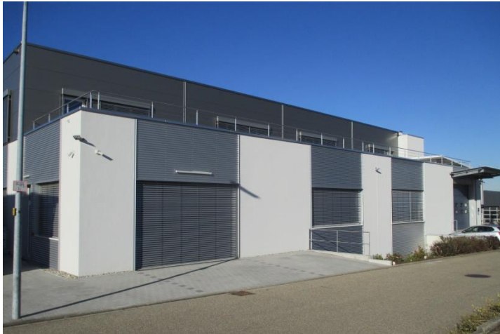
Ansicht fertiges Produktionsgebäude

Dreigeschossiges Produktionsgebäude in Massivbauweise, Wände größtenteils als Betonhalbfertigteile mit Ortbetonergänzung, Ausführung Obergeschoss als Stahlbau.