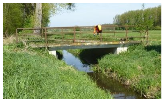
Brücke über den Katzengraben (BW 56)