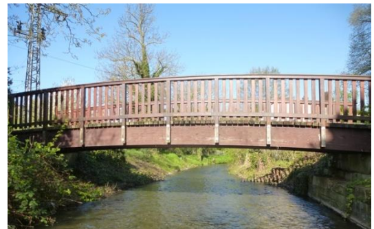
Festhallensteg über die Pfinz (BW 24)