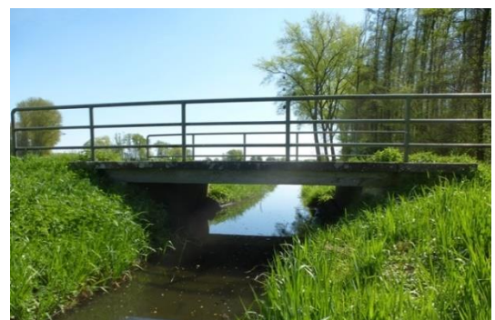
Brücke über den Katzengraben (BW 55)