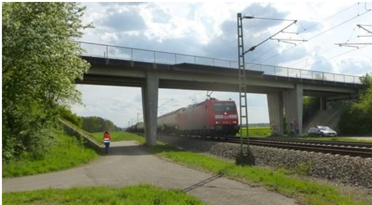
Brücke über die Bahn Spöcker Straße (BW 35)

Durchführung der Hauptprüfung bei insgesamt 7 Brücken (Massivbrücken und Holzbrücke) der Gemeinde Graben-Neudorf.