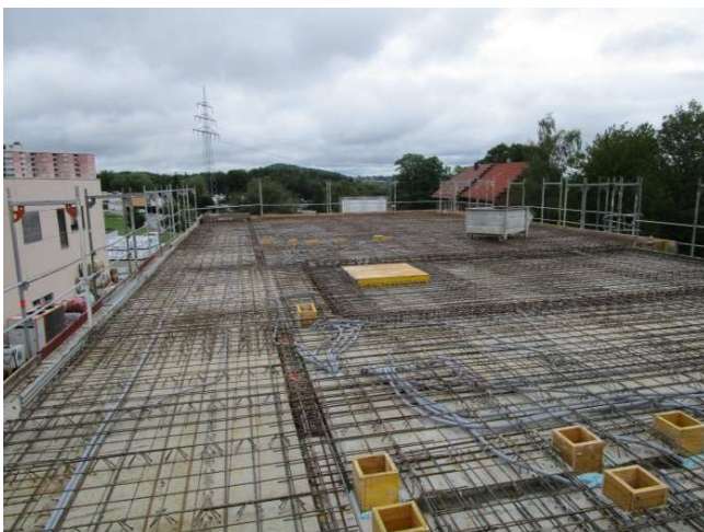
Obere Bewehrungslage Decke