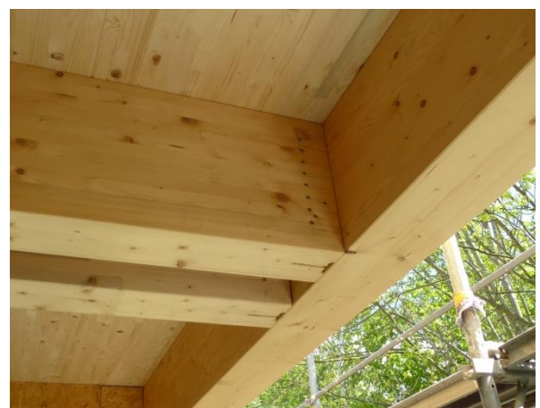
Eindrücke während der Bauphase