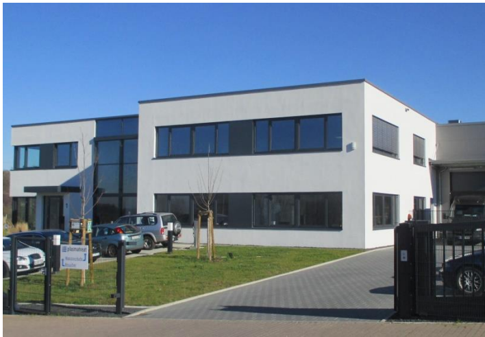
Ansicht fertiges Gebäude

Zweigeschossiges gewerbliches Gebäude in Massivbauweise Grundrissabmessungen: ca. 27 m x 26 m Baujahr: 2018 Bauherr: CBI Verwaltungs GmbH & Co. KG, Bielefeld Planung: Gewerbebau Schumacher & Partner GmbH, Birkenfeld Tragwerksplanung (LP 1-6): Ing.-Büro Braun GmbH & Co. KG