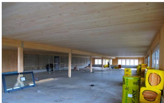
Eindrücke während der Bauphase