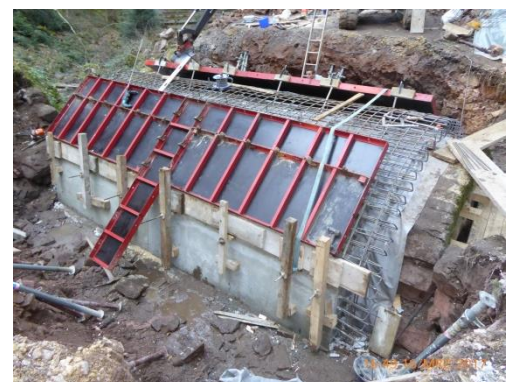
Bewehrung tragende Betonschale