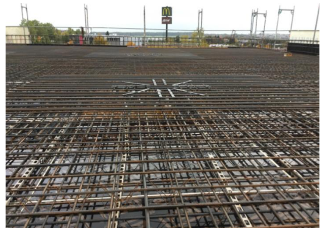
Deckenbewehrung mit Dübelleisten