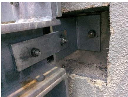
Anschluss Stahltreppe an Bestand