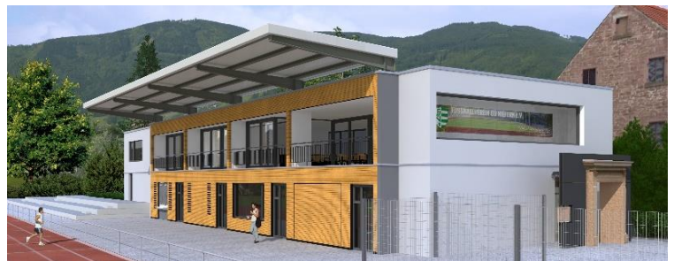
Ansicht (Auszug Plan Architekt)

Grundrissfläche: ca. 41 m x 10 m Umbautes Volumen: ca. 1470 m 3 Nutzfläche: ca. 385 m 2 Baukosten ca. 600.000 € (brutto)