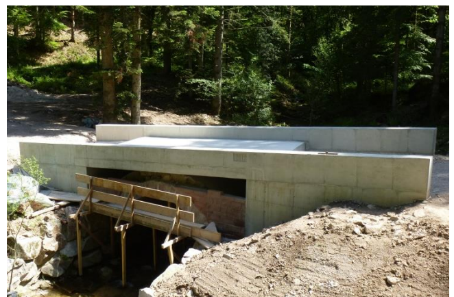
Gewölbeinstandsetzung n der Bauphase