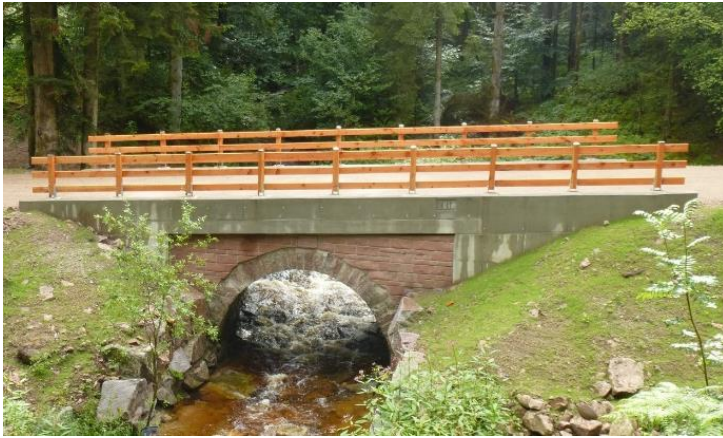
Ansicht instandgesetzte Brücke

Instandsetzung einer Natursteingewölbebrücke unter Erhaltung des bestehenden Naturstein-Gewölbes.