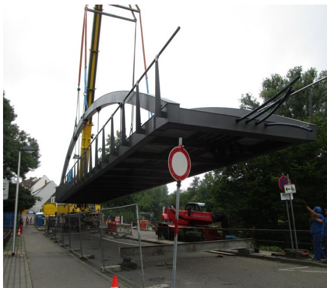
Einheben des Überaus