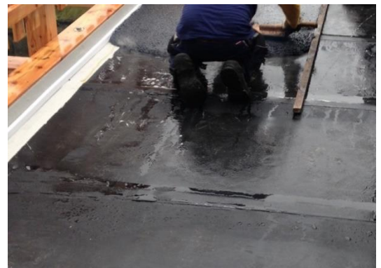
Belagsarbeiten: abdichten der Fahrbahn und Schrammbord-Anschluss