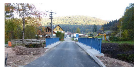
Neue Brücke über den Rohnbach