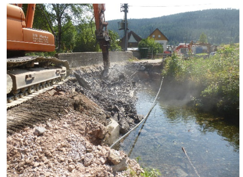
Abbruch bestehende Brücke