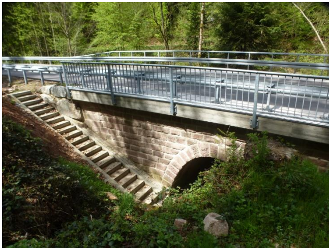
Ansicht Brücke über den Trombach

Instandsetzung dreier Natursteingewölbebrücken im Zuge der L 108. Ersatz der abgängigen Brüstungen durch Stahlbetonkappen. Einbau neuer, aktuell zulässiger Schutzeinrichtungen.