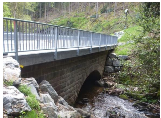
Mittlere Brücke vor und nach der Instandsetzung