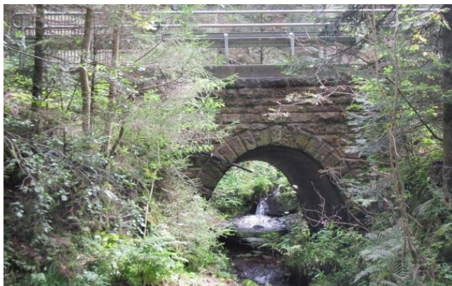
Brücke über den Trombach vor der Instandsetzung

Objekt- und Tragwerksplanung: Ing.-Büro Braun GmbH & Co. KG