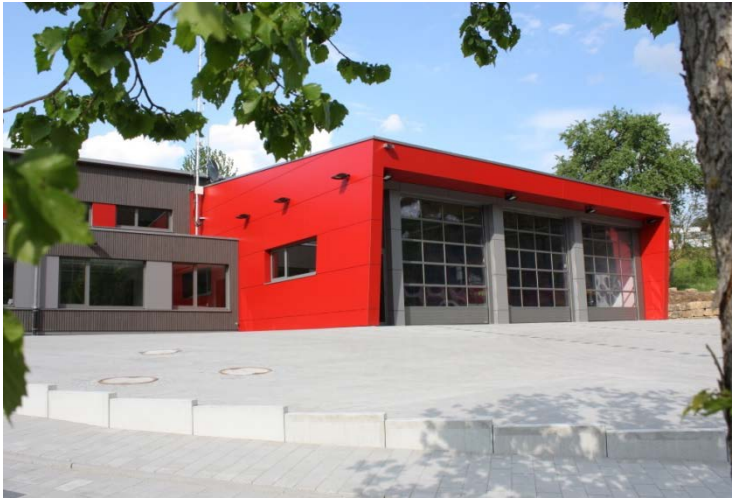
Verwaltungsbau und Fahrzeughalle

Neubau eines Feuerwehrgerätehauses mit zweigeschossigem Verwaltungsbau in Holzständerbauweise, Fahrzeughalle mit eingespannten Stahl-Holz-Stützen (Brandschutz F30) und freistehendem Übungsturm in Stahlbauweise.