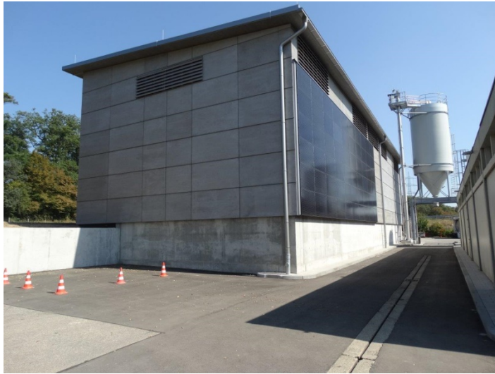
Salzhalle der Autobahnmeisterei in Pforzheim

Neubau von zwei nahezu baugleichen Salzlagerhallen als Brettschichttrahmenkonstruktionen mit tragendem Brettsperrholzdach und Wandscheiben auf Stahlbetonstützwänden.