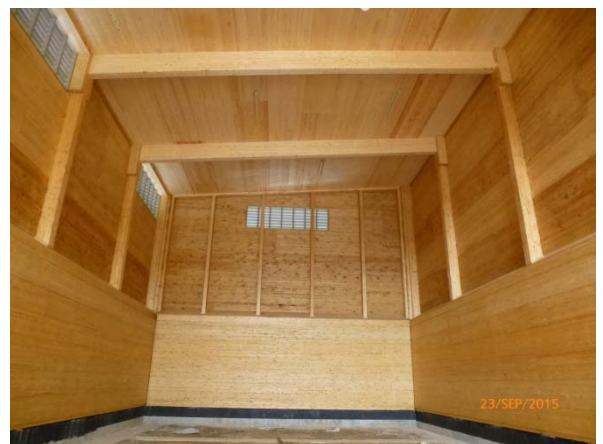
Bauphase und Innenansicht der Hallen Maulbronn und Pforzheim