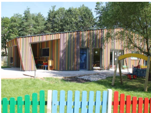
Anbau nach Fertigstellung