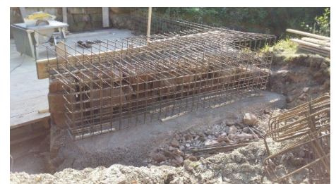
Bewehrung Hinterbeton der bestehenden Naturstein-Widerlager