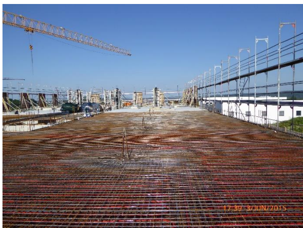
Bewehrung einer Ortbetondecke