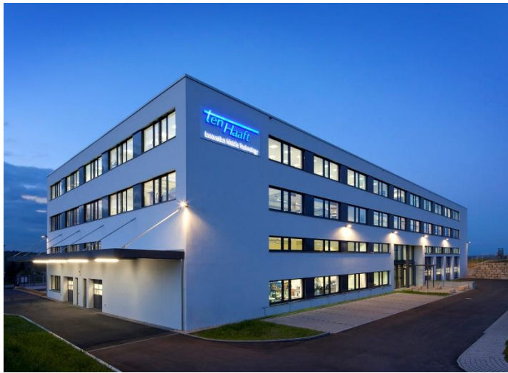
Außenansicht fertiges Gebäude

Neubau eines viergeschossigen Gewerbegebäudes mit punktgestützten Flachdecken und Spannbetonhohlkörperdecken sowie Gründung auf Ramm-pfählen.