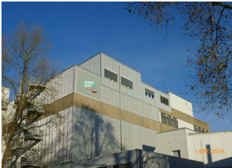
Ansicht bestehendes Kühlhaus mit Aufstockung

Neubau eines Bürogebäudes in Holzbauweise auf dem bestehenden Kühlhaus mit umfangreichen Umbauten im Bestand. Herstellung eines rund 11 m langen Verbindungssteiges als verglaste Stahlkonstruktion.