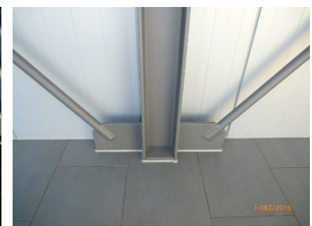
Anschlussdetail Zugstäbe Steg