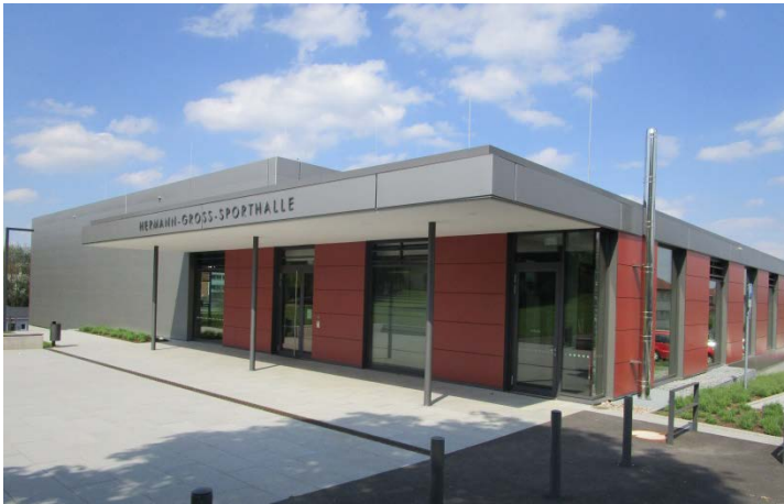
Außenansicht Eingangsbereich Halle

Neubau einer 3-Feld-Sporthalle mit Brett-schichtholz-binder-Dachkonstruktion auf Stahl- und Stahlbetonstützen und Stahlbetonwänden sowie zweigeschossigem Nebentrakt in Sichtbeton.