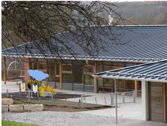
Außenansicht fertiges Kinderhaus

Neubau eines Kindergartens in kombinierter Massivbauweise aus Stahlbeton und Mauerwerk mit Stahl und Holz. Gründung auf elastisch gebetteter Bodenplatte.