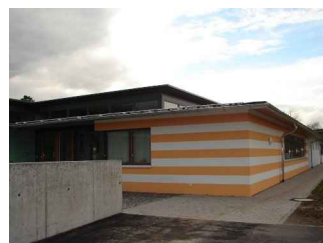
diverse Außen- und Innenansichten des fertigen Bauwerks