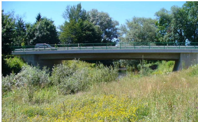
Ansicht fertige Brücke

Ersatzneubau als Stahlbeton-Rahmenbrücke auf kombinierter Pfahl-Plattengründung in Form eines schlaff bewehrten, integralen Bauwerks im Zuge der Kreisstraße K 7981