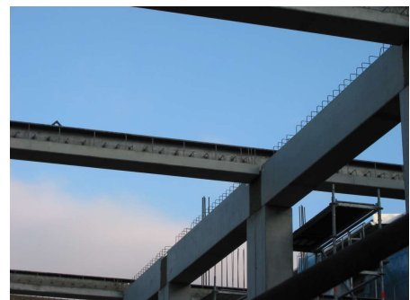
Dachdecke der Fabrik im Bau