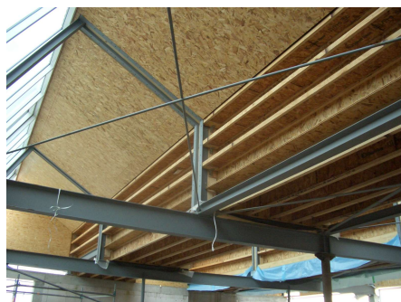
Dachkonstruktion der Galerie im Bau