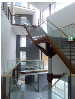
Erschließungstreppe im Ausstellungsbereich