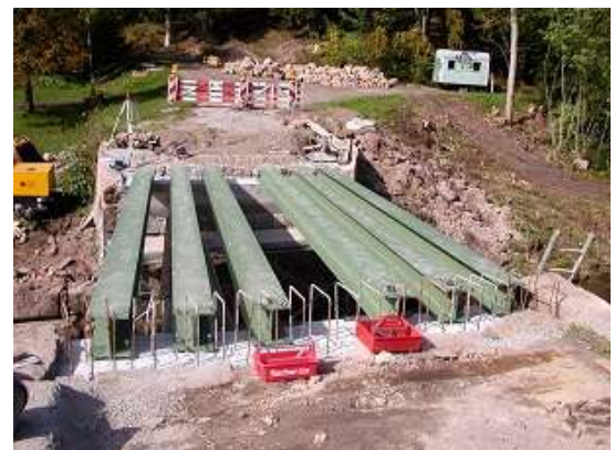
Einbau Stahlträger HEB 300