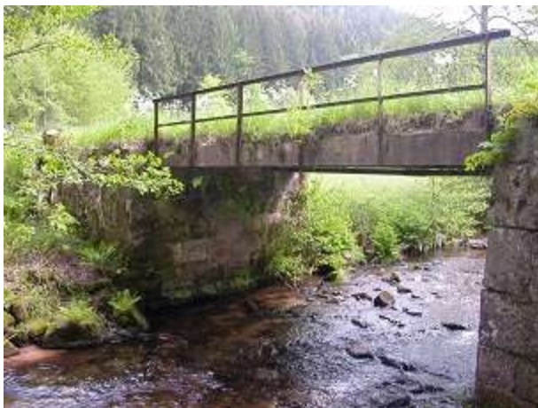
Brücke vor der Sanierung

Objekt- und Tragwerksplanung, Bauleitung: Ing.-Büro Braun & Partner GbR