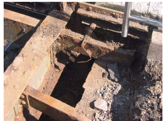
Korrodierte Träger unterhalb der Fahrbahn