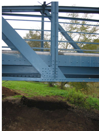
Detail Fachwerk-Knotenpunkt und Lager am Brückenende

Objekt- und Tragwerksplanung, SiGe-Koordination: Ing.-Büro Braun & Partner GbR