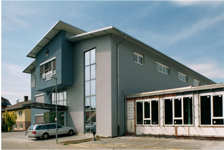
Eingangsbereich des fertigen Erweiterungsbaus

Erweiterung eines Produktionsgebäudes mit Büro- und Sozialräumen als 3-geschossiger Massivbau mit Bohrpfehlgründung.