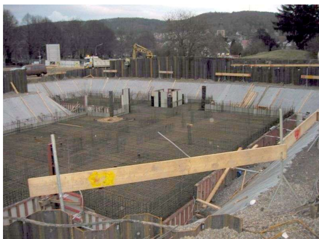
Bewehrung Bodenplatte Bauteil West

Neubau eines Altenpflegeheims in Stahlbeton-Massivbauweise.