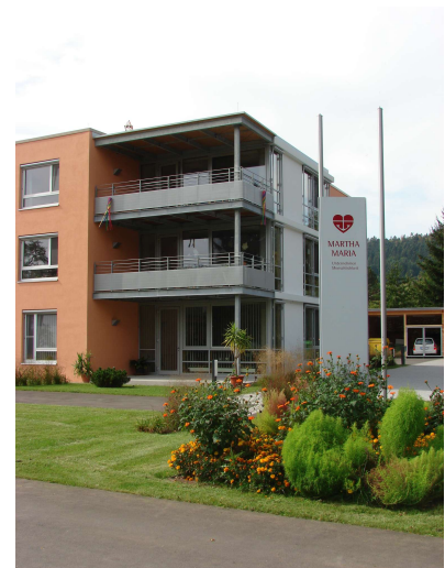
Ansicht Balkone Nord