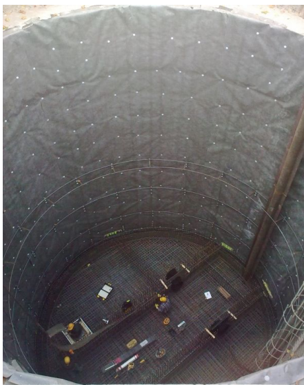
Bewehrungsarbeiten am Düker-Unterhaupt