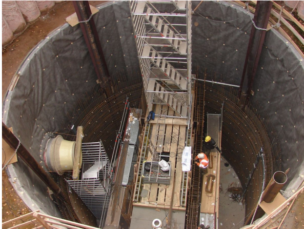
Bewehrungsarbeiten am Düker-Oberhaupt

Neubau von insgesamt 11 Schachtbauwerken einschl. der zugehörigen Baugrubenverbauten, darunter Ober- und Unterhaupt des Luftkissendükers mit Bauwerkstiefen bis 17 m unter Gelände.