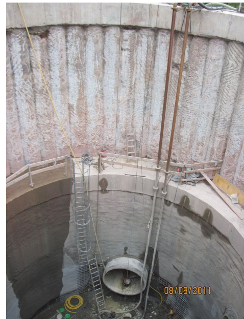
Bohrfahl- und Spritzbeton-Ringverbau