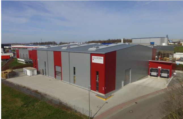
Ansicht fertige Halle

Teilweise zweigeschossige Produktionshalle Grundrissabmessungen Halle: ca. 45 m x 40 m