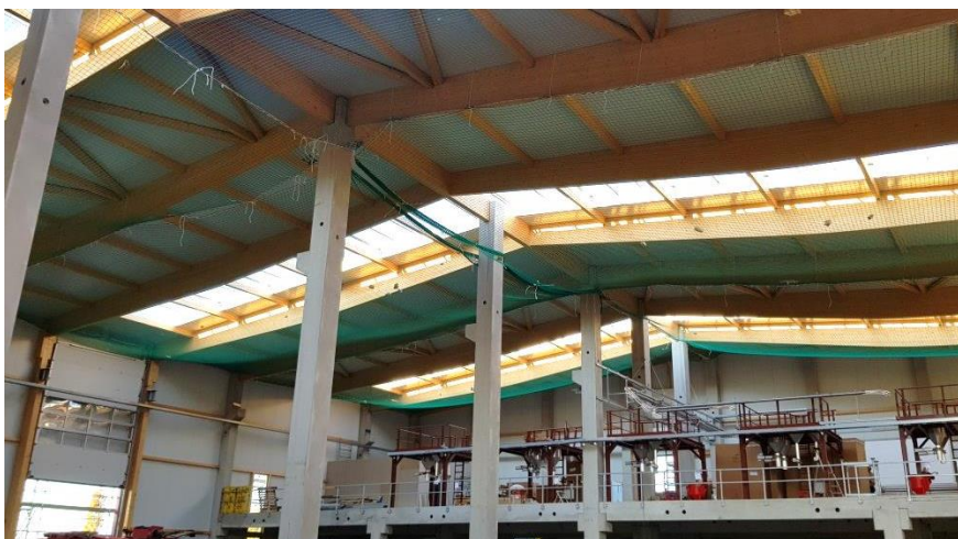
Innenansicht Produktionshalle (Bauphase)