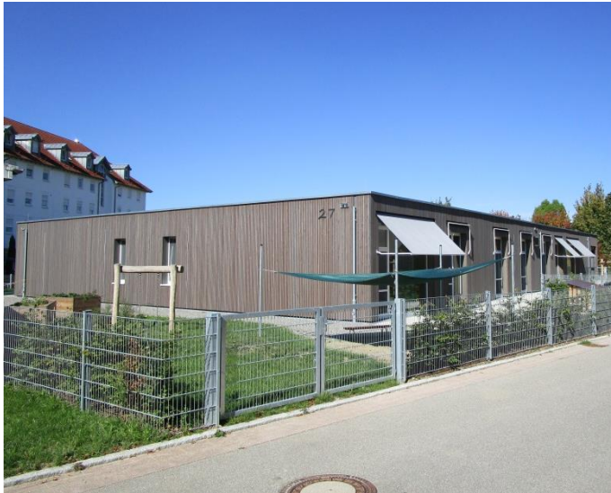
Ansicht fertiges Gebäude

Eingeschossige Kindertagesstätte in Holzbauweise