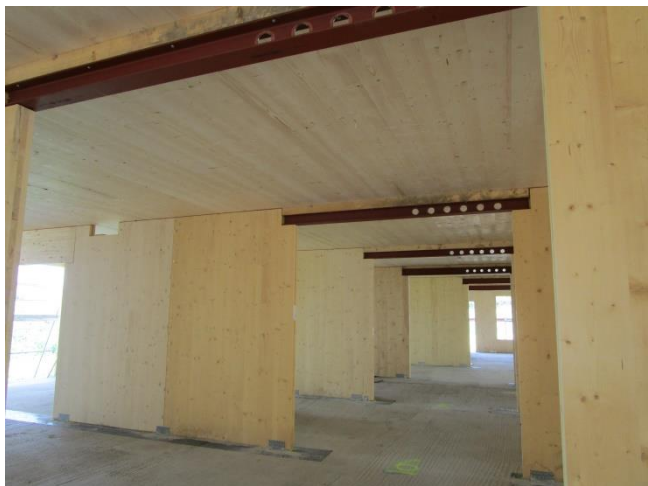
Innenansicht während Bauphase