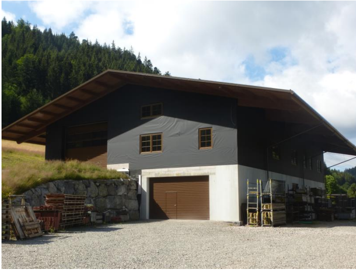
Ansicht fertiges Gebäude

Neubau eines Zimmereibetriebs mit Teilunterkellerung.