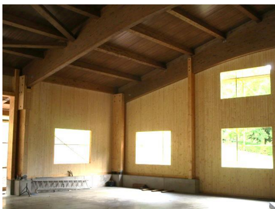
Ansicht aussteifende eingespannte Stützen