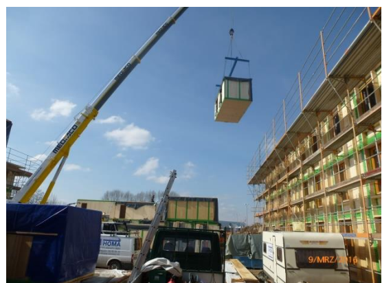
Einheben eines vorgefertigten Moduls