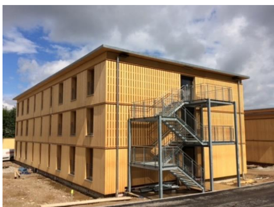
Modul und außenliegendes Treppenhaus in der Bauphase