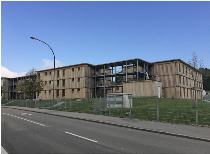
Ansicht fertiger Gebäudekomplex

Gebäudeensemble aus insgesamt 5 dreigeschossigen Wohn- und 2 zweigeschossigen Sozialgebäuden in Holzmodulbauweise mit außenliegenden Treppenhäusern.