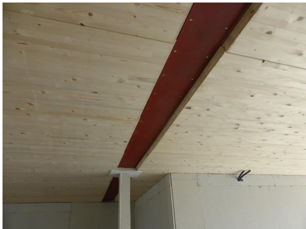
Untersicht Decke während der Bauphase