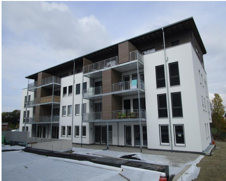
Außenansicht eines Gebäudes

Zwei viergeschossige Wohn- und Geschäftsgebäude in Holzständerbauweise mit vorgesetzten Stahlbalkonen und Geschossdecken in Holzbetonverbundbauweise. Beide Gebäude abgefangen auf einer massiven Tiefgarage.