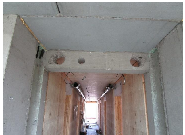
Aufnahmen von innen während der Bauphase