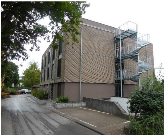
Außenansicht mit Stahltreppe