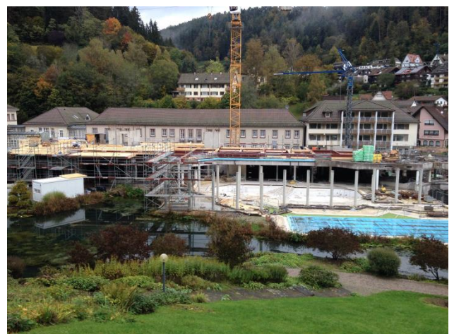
Schwimmhalle während der Bauphase