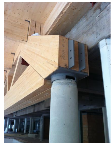
Detail Auflager Fachwerkträger