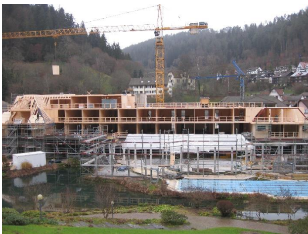
Hotel während der Bauphase