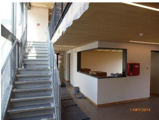
Ansicht von innen während der Bauphase