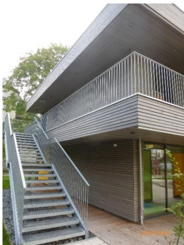
Außentreppe aus Stahl