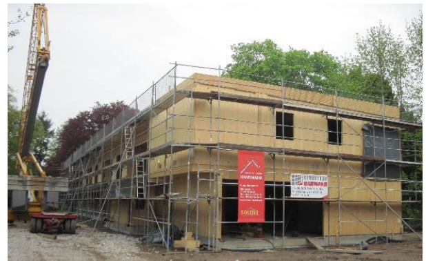
Ansicht während der Bauphase