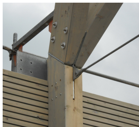
Detail Traufknotenpunkt mit Aussteifungsseilen