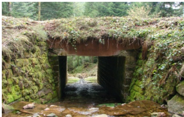
Hennebächlesbrücke: Ansicht oberstrom nach bzw. vor der Instandsetzung

Planung und Bauleitung: Ing.-Büro Braun GmbH & Co. KG