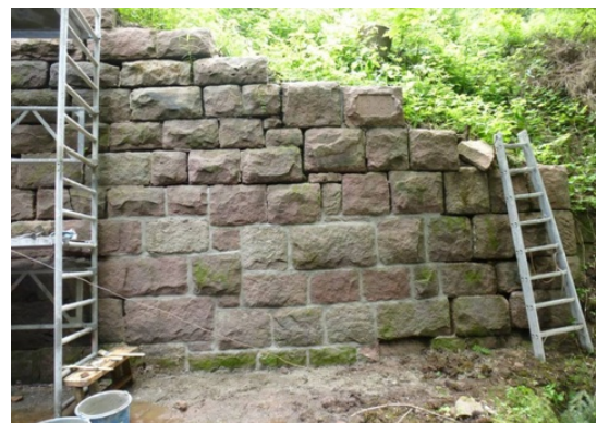
Dietersbrunnenbrücke: Mauerwerksinstandsetzung Flügel unterstrom