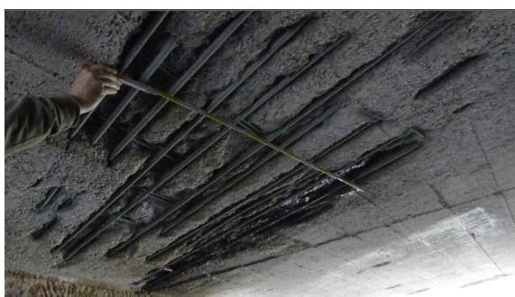
Hennebächlesbrücke: Detail freiliegende Deckenbewehrung