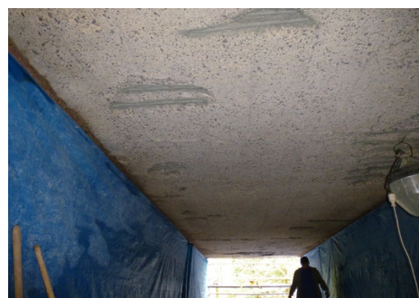
Dietersbrunnenbrücke: Detail Deckeninstandsetzung