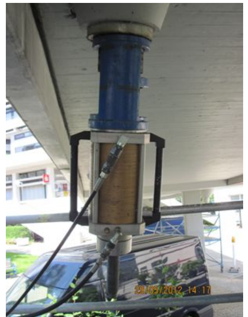
Justieren / Nachspannen der Kabel mit hydraulischen Spannpressen