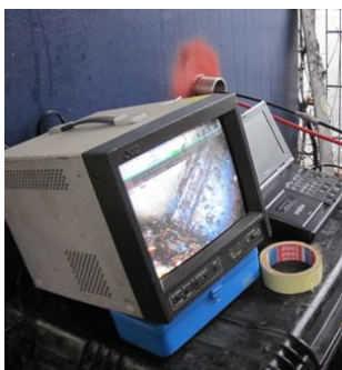
endoskopische Untersuchung Pylonfuß und Dichtheitsprüfung