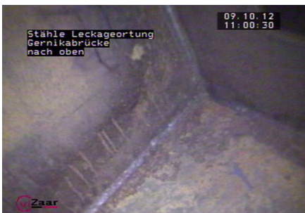
Innenaufnahme der Endoskopie