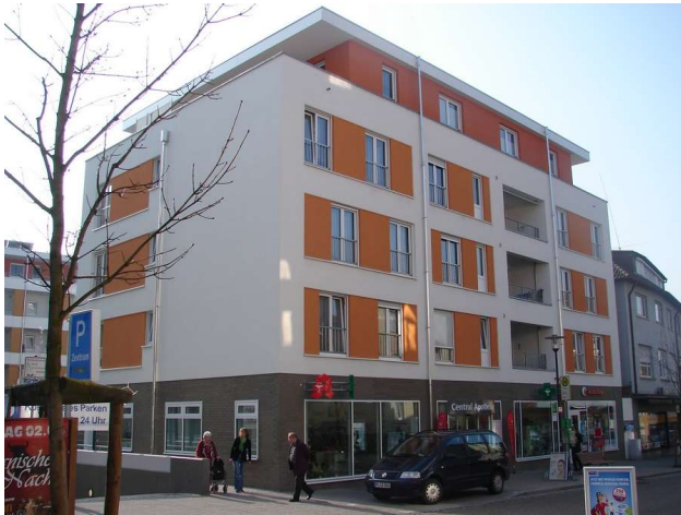
Ansicht Bahnhofstraße mit Ladengeschäften im EG

Prüfung der bautechnischen Nachweise und Konstruktionspläne sowie Bauüberwachung für den Neubau der mehrgeschossigen Wohnanlage mit Tiefgarage und Ladengeschäften in Massivbauweise.