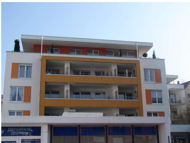
Balkone Wohnungen und Einfahrt Tiefgarage